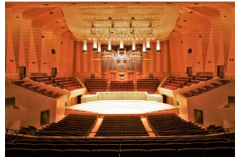
東京初のコンサート専用ホール