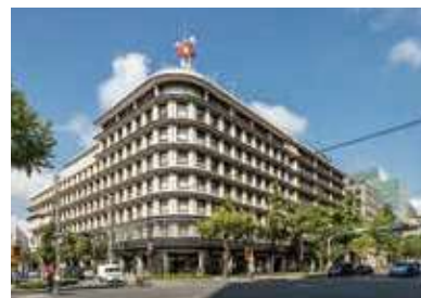
大阪ガスビル (大阪ガス本社) 1933・1966