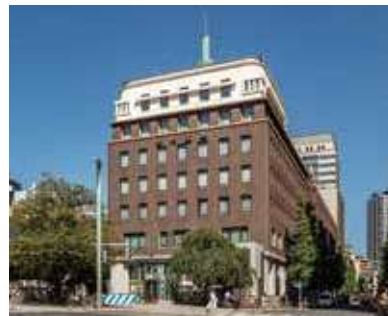
日本橋野村ビル (野村證券本社) 1930・1959・1981