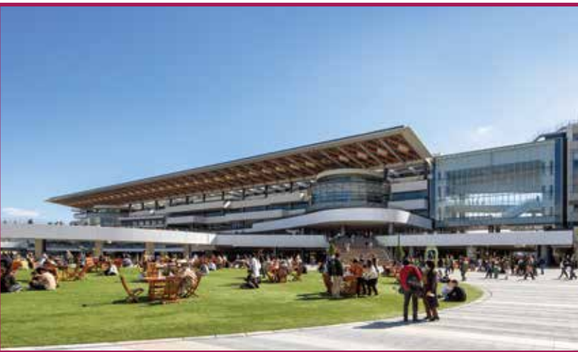
京都競馬場 Kyoto Racecourse 2023

安井武雄建築事務所創設 Founded in Osaka by Takeo Yasui.