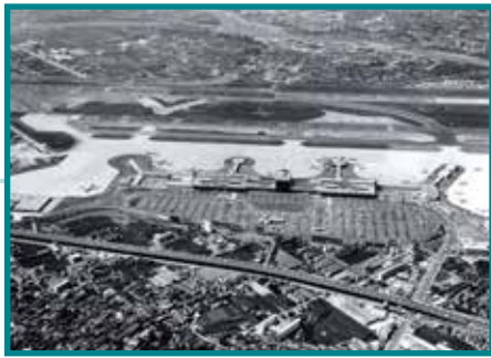
関西国際空港 庁舎・管制塔 Kansai International Airport Administration Office Building and Control Tower 1992