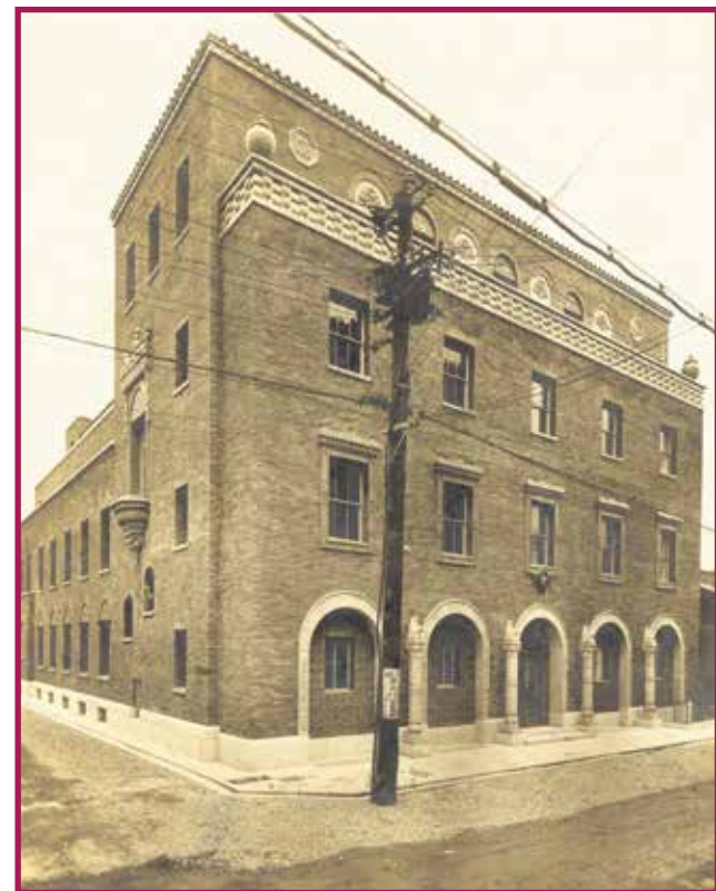
大阪倶楽部 Osaka Club 1924

'The ultimate in the beauty of urban architecture.' - Togo Murano