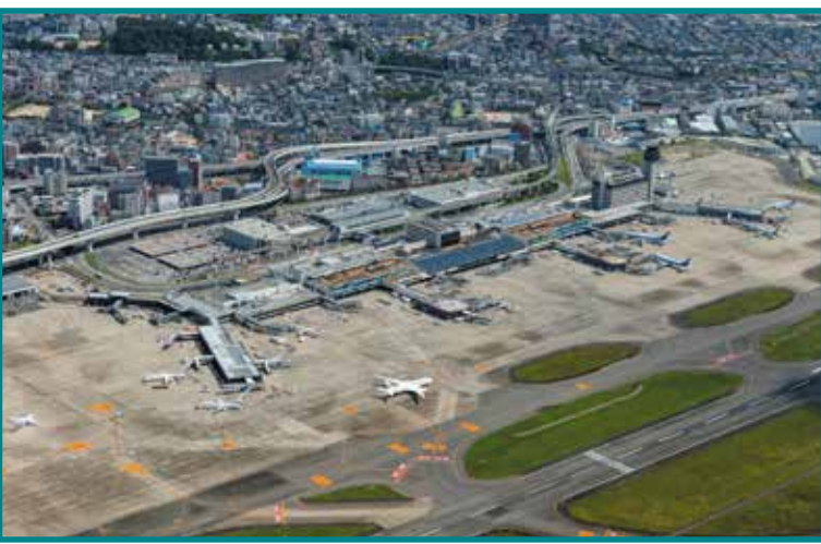
大阪国際空港(伊丹空港)ターミナルビル(改修) Osaka International Airport (Itami Airport), Renovations 2020