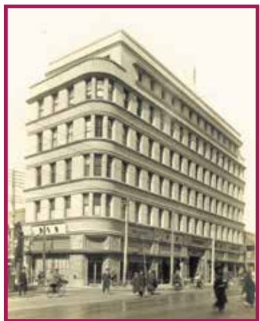
高麗橋野村ビルディング Kouraiabashi Nomura Building 1927

'A southern European style with a touch of oriental influence' - Takeo Yasui