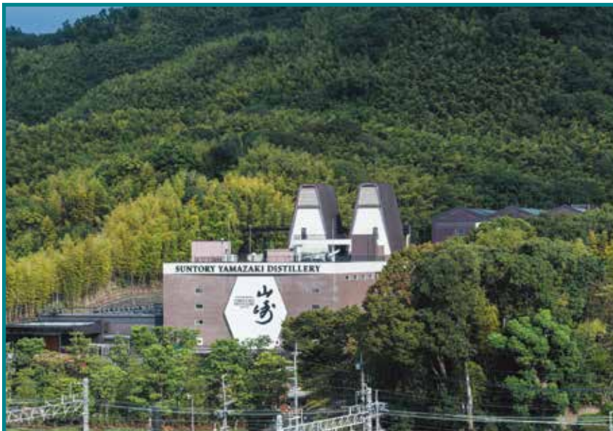
サントリー山崎蒸溜所 Suntory Yamazaki Distillery 1959

'A southern European style with a touch of oriental influence' - Takeo Yasui