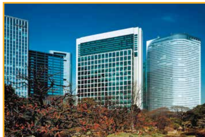
東京汐留ビルディング/コンラッド東京 Tokyo Shiodome Building / Conrad Tokyo 2005