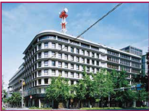
大阪ガスビルディング(北館増築) Osaka Gas Building (North building expansion) 1966