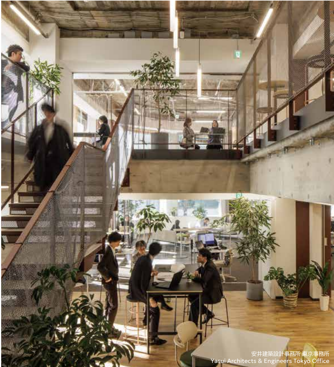
安井建築設計事務所 東京事務所 Yasui Architects & Engineers Tokyo Office