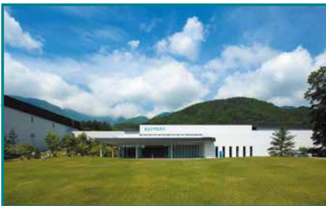
サントリー天然水 南アルプス白州工場 Suntory Minami-Alps Hakushu Water Plant 2015