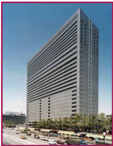
大阪ターミナルビル アクティ大阪 Osaka Terminal Building ACTY OSAKA 1983