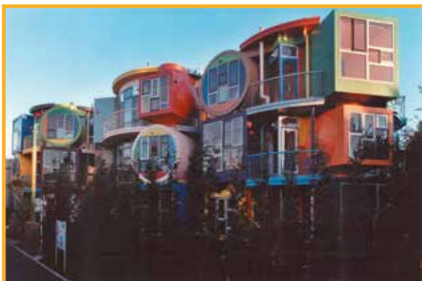
三鷹天命反転住宅 ~In Memory of Helen Keller~ Reversible Destiny Lofts Mitaka In Memory of Helen Keller 2005