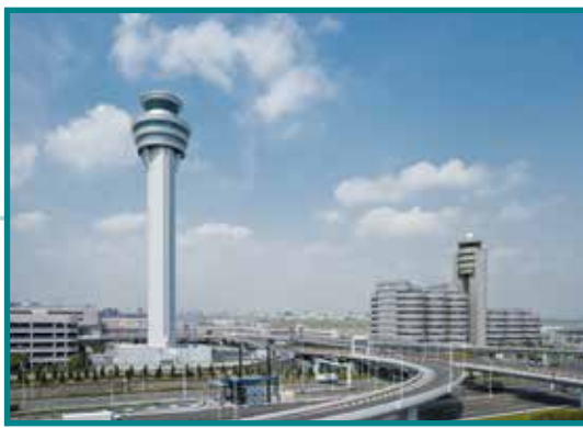
東京国際空港(羽田)新管制塔 Tokyo International Airport (Haneda) New Control Tower 2009