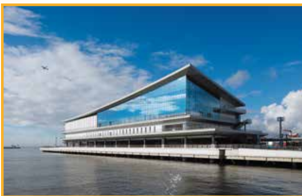
東京国際クルーズターミナル Tokyo International Cruise Terminal 2020