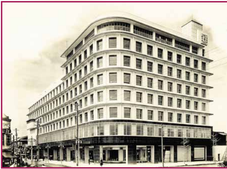
大阪ガスビルディング Osaka Gas Building 1933

'Free form based on purpose and structure' - Takeo Yasui