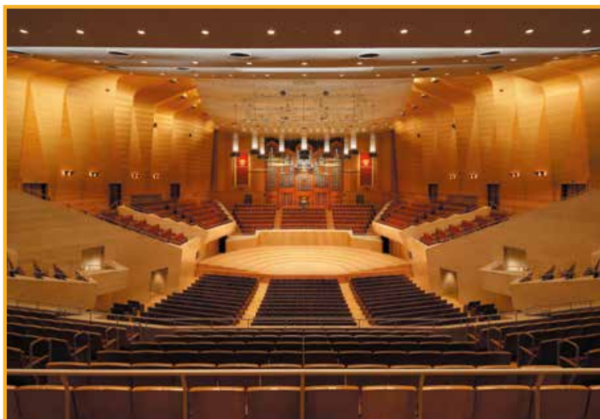
サントリーホール Suntory Hall 1986