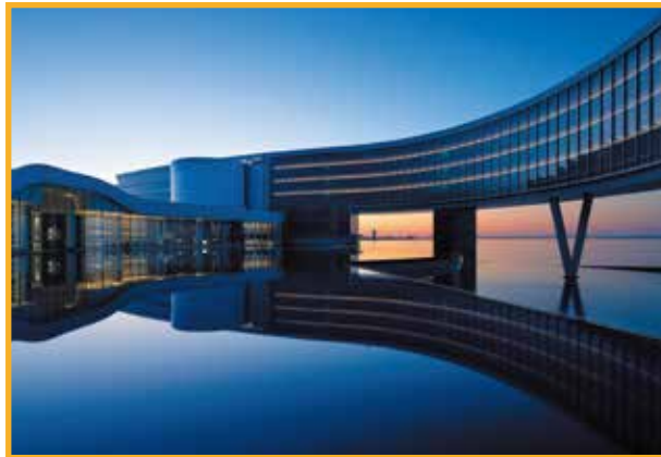
ラグーナバークコート倶楽部 ホテル&スパリゾート Laguna Baycourt Club Hotel & Spa Resort 2019