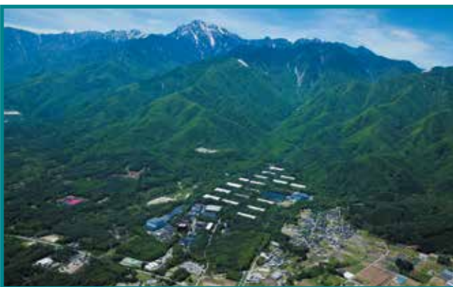
サントリー白州蒸溜所(改修) Suntory Hakushu Distillery, Conversion 2023