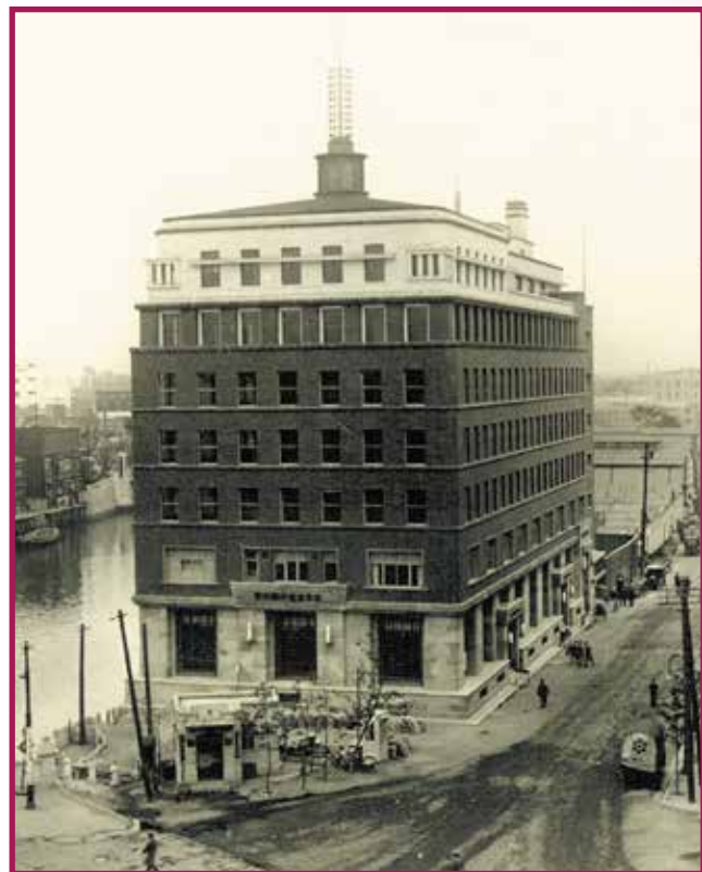
日本橋野村ビルディング Nihonbashi Nomura Building 1930