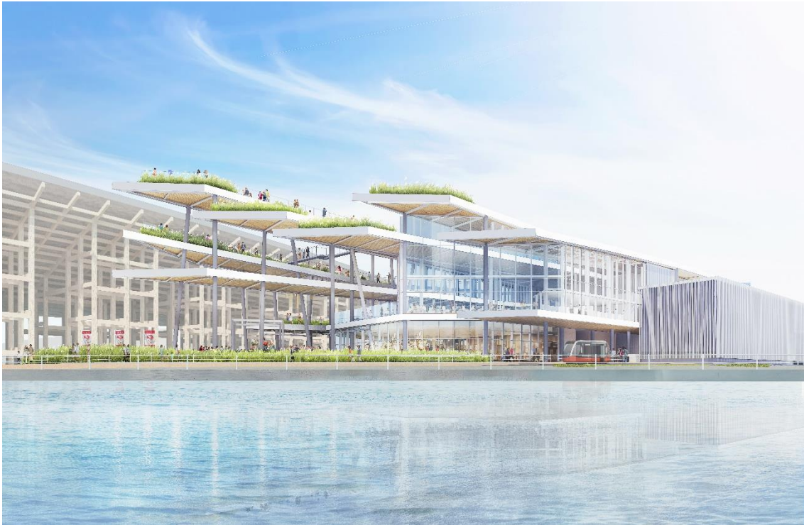
小催事場外観パース図①

古代から国際交流のゲートであり続けたこの場所の海や大地との関係をセレブレートする、生命のような建築です。複数の帯状のスラブが織りなす屋外の広がり、屋内の催事の場が入り混じる、生き生きとした環境を目指しました。敷地に対して斜めにかしいだ帯の方向は、関西を斜めに貫く地形のしわと同期し、淀川水系へと抜ける定常風の方向とも概ね一致しています。このようにしてジオグラフィックな生命体としての地球と結びつけられた建築は、風や水、光のエネルギーをまとった、未来の記憶となるでしょう。