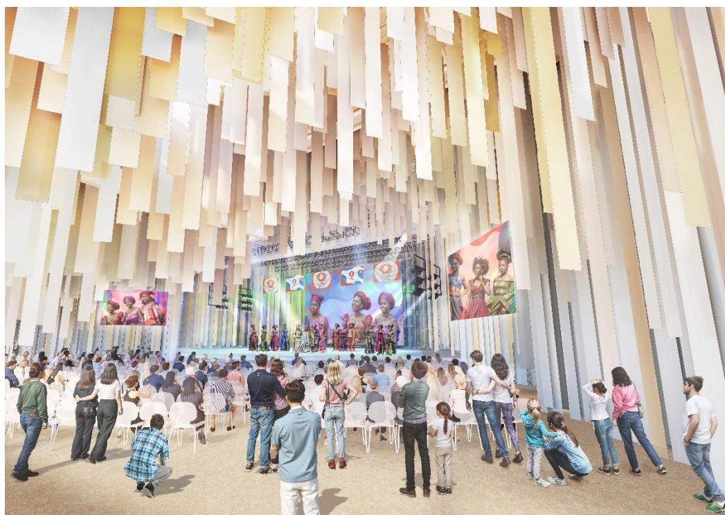
小催事場内観パース図