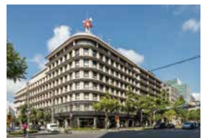
大阪ガスビルディング（大阪ガス本社）1933・1966