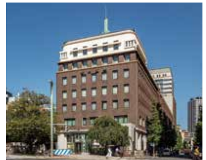
日本橋野村ビル（野村證券本社）1930・1959・1981